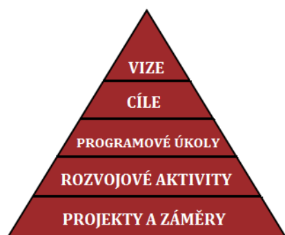
Obr. 1: Struktura strategického plánu pro orientaci v Akčním plánu

Jednotlivé úrovně jsou definovány ve Strategickém plánu rozvoje města následovně: