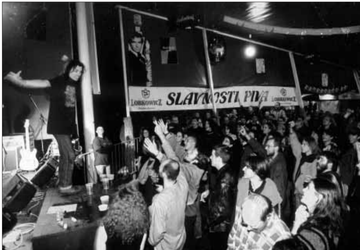
Nabitý program přilákal do Riegrových sadů tisíce návštěvníků, kteří se přišli pobavit a poslechnout si oblíbené skupiny