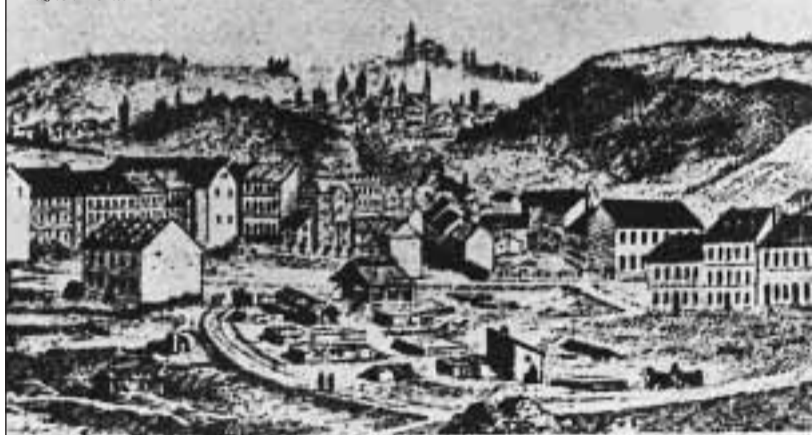
Žižkov roku 1872