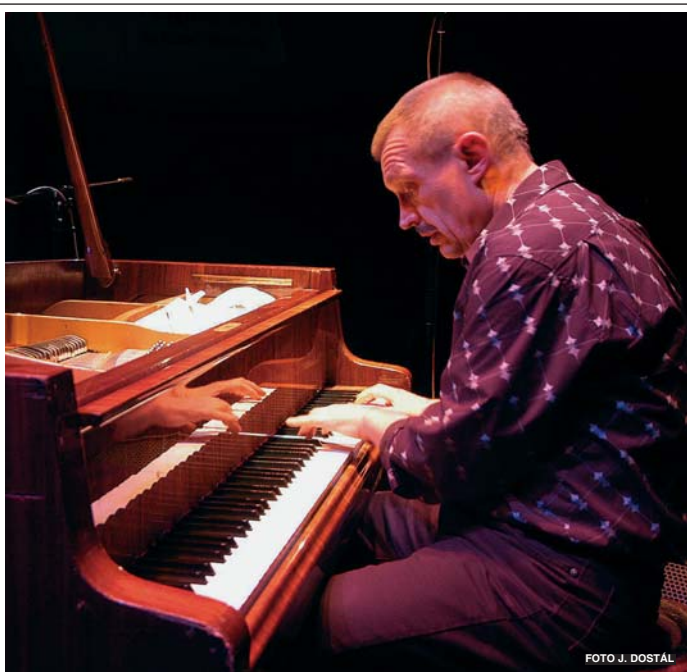
Ve dnech 5. a 6. 11. proběhl v Paláci Akropolis multý ročník jazzového festivalu s názvem „Žižkov meets jazz“. Jeho pořadatelé na vlastní kůži poznali, že začátky jsou těžké, ale festival si své návštěvníky nakonec našel, zvláště v druhý den, který byl věnován klasickému jazzu a v rámci něhož vystoupily i jazzové legendy Vlasta Průchová a Emil Viklický (na snímku).