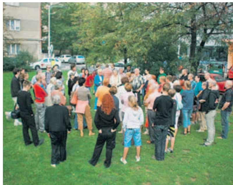
Na obranu parku vytvořili občané sdružení, radnice jim podala pomocnou ruku