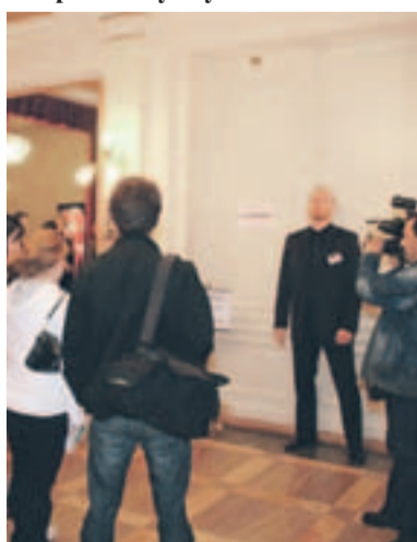
Dražba parcely probíhala za zavřenými dveřmi střeženými bodyguardy.