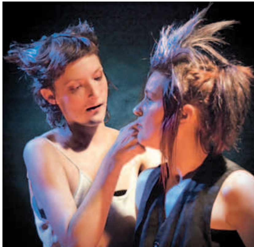
Ženský divadelní improvizací punk

dět u stolečků, budou moci kouřit a pít. Budou moci být blíže, než kdykoliv předtím... Provokativní představení o sexu, nesnášenlivosti, o společnosti, která se rozhodla zničit, a při němž pokaždé vznikne nový originální obraz malíře Jana Mika Svět odsouzcův zahájí festival 21. ledna. Na 22. ledna je připravena existenciální detektivka pro jednoho herce Unicorn. Ta je prv-