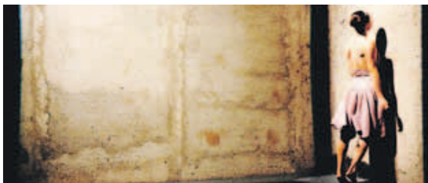
Hlas Anne Frankové