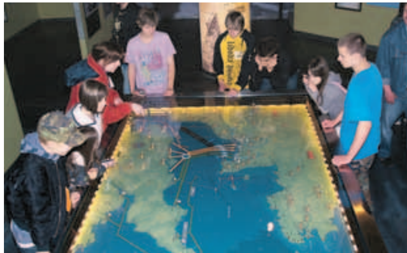
Nad mapou vyloďení v Caen memorial.