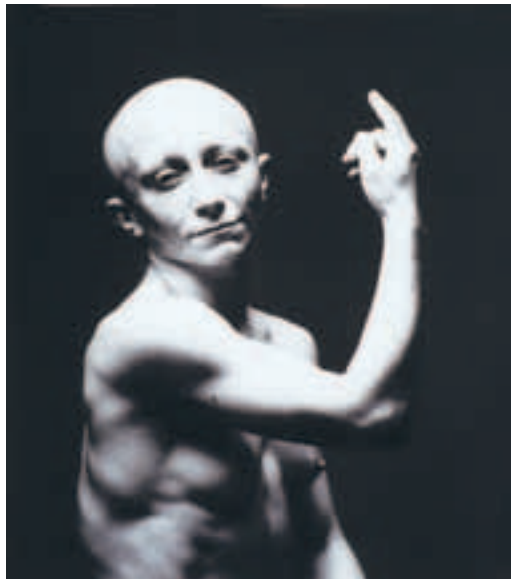
Teatr Novogo Fronta