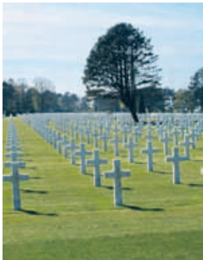
Vojenský hřbitov v Colleville-sur-Mer.