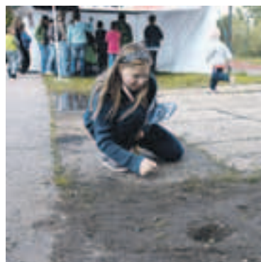
Akce Barikáda nabídla i zajímavý doprovodný program, například výstavu dokumentů o Pražském povstání, besedu s historiky i hry pro děti, například už skoro zapomenuté cvrnkání kuliček.