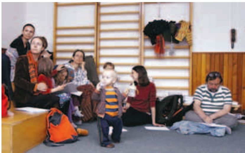
Aktivní rodiče využili možnost probrat se zástupci radnice otázky zeleně.

Veřejným setkáním na téma zeleň, rodiče a děti v Praze 3 pokračovala v úterý 18. května série pravidelných debat radnice s veřejností. Logicky se hovořilo především o dětských hřištích a jejich vybavení.