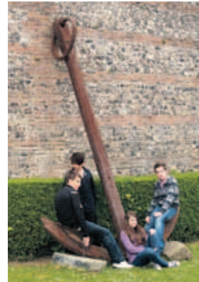
Na nádvoří hradu v Dieppe.

Snímky dokumentují zájezd žižkovských školáků do Normandie na místa bojů II. světové války. Radnice takto odměnila všechny finalisty dějepisné soutěže. Žprávy o tom, co všechno viděli a zažili, si můžete přečíst na webových stránkách městské části.