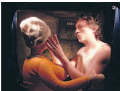
Buchty a loutky

Toto lingvisticko-divadelní neformální uskupení bylo založeno proto, aby v žádném případě nenastavovalo zrcadlo. Nikomu, Nietzschemu a hlavně ne divákovi. Bizarní komedie Posnídám později je stěžejní uvěřitelné divadelně lingvistické dílo, které místy až hraničí s hereckým masochismem. Jeho cílem je v první řadě posunout hranice vnímání českého jazyka mnohem dále, než byste čekali. Pokud navštívíte divadlo proto, abyste se pobavili, je vysoce pravděpodobné, že právě Posnídám později je tou správnou volbou. ■