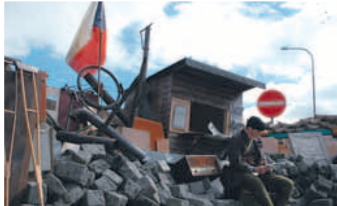
Žižkovská barikáda v Top 20 agentury Reuters – dva snímky českého fotografa Daniela Poláčka vybrala největší světová zpravodajská agentura do týdenního výběru dvaceti nejlepších fotografií světa. Druhý snímek a rozhovor s autorem naleznete na www.praha3.cz .