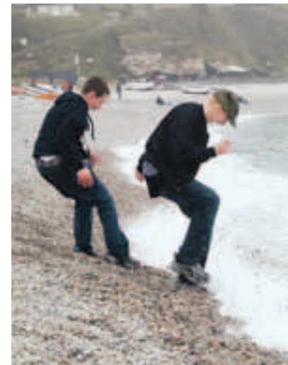
První kontakt s Atlantikem v Etretatu

ního ročníku v pondělí 3. května v Národním památníku na Vítkově. Vedle ovací si školáci odnesli také hlavní cenu – pětidení zájezd do Normandie, kam se nakonec vypravili všichni finalisté. Vítězná práce mapuje životní osud žižkovského rodáka.