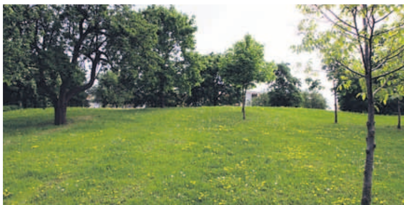
Park Na Krejcárku nabídne novou možnost aktivního trávení volného času – discgolf