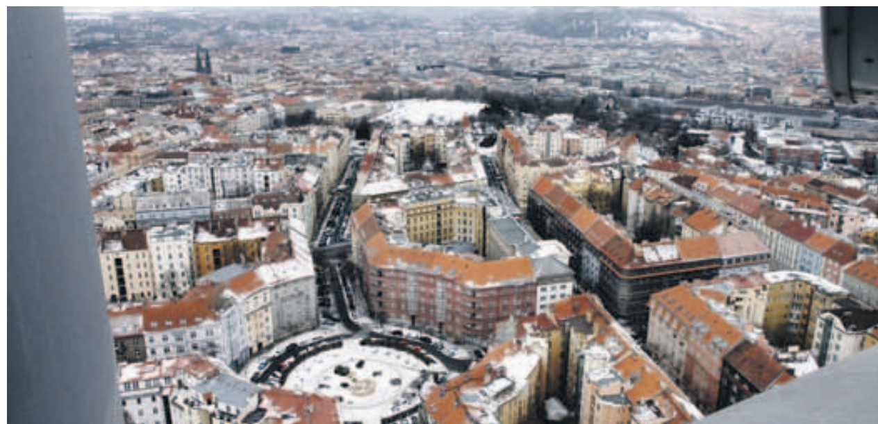
Škroupovo náměstí z výšky 120 m

byste si chtěli miminka prohlédnout zblízka, přijďte na dvůr žižkovské radnice, na střeše jednoho z technických objektů leze jednácté). V nočních hodinách je