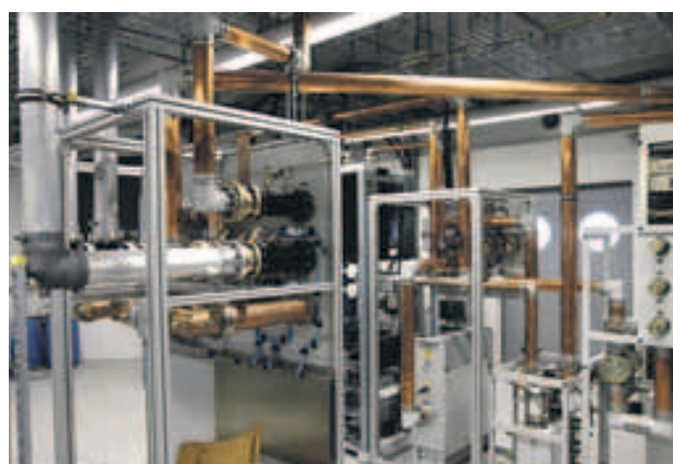
V měděných potrubích jsou koaxiální kabely zajišťující vysílání všech tří multiplexů