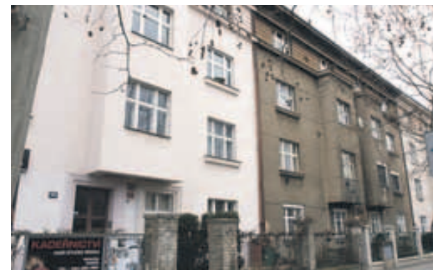
V domě na Koněvově 191 dojde k opravě základů a suterénu

zástupce starosty pro bydlení Tomáš Kalousek.