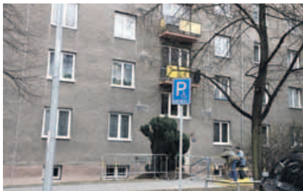
Dům Pod Lipami 62 bude mít nový osobní výtah

„Fond obnovy a rozvoje jsme pro letošní rok značně posílili. Radnice chce podporovat půjčkami a dary soukromé majitele především k investicím, které mají význam pro estetický, urbanistický a kulturní vzhled městské části. Peníze však pomáhají také řešit neodkladné opravy jako v tomto případě, a to především u domů, jenž jsou ve správě družstev či společenství vlastníků bytových jednotek,“ dodal