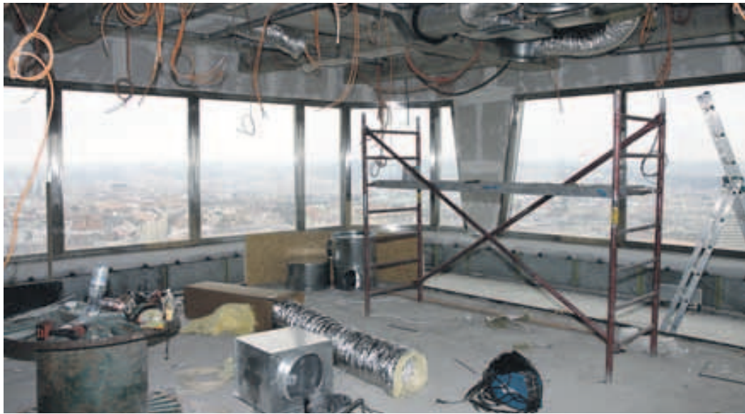
Restaurace – současný stav