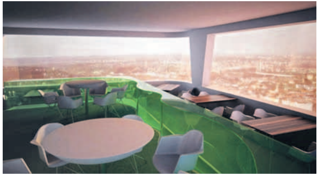
A takhle by měla restaurace po dokončení vypadat (vizualizace)

Eleganci, komfort, jedinečnost a moderní design, korespondující s architektonickým stylem této kontroverzní stavby – tak se již v červnu představí nově zrekonstruovaný interiér Žižkovského vysílače. Ten byl nedávno zpravodajským serverem CNN vyhlášen čtvrtou nejohlednějším stavbou světa a na serveru virtualtourist.com se v obdobném hodnocení umístil dokonce na místě druhém.