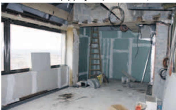
Hotelový pokoj „James Bond Apartmá“ s unikátním výhledem (aktuální a finální stav)