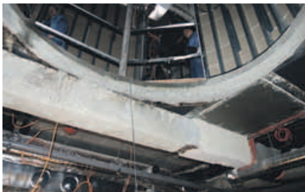
Ústřední schodiště spojující gastropatro a zázemí (aktuální a finální stav)