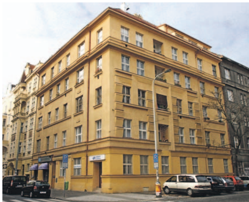
... a dům v Ondříčkově jsou již připraveny k prodeji