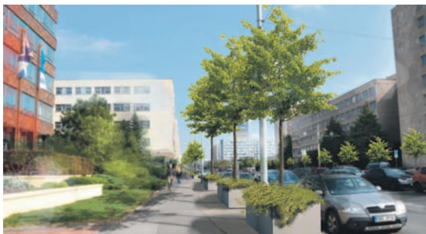
Vizualizace umístění mobilní zeleně na Olšanské ulici

Ideálním řešením by zde bylo vysadit klasické stromořadí, tomu