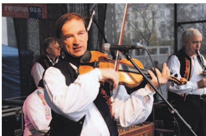
Zahrála cimbalová muzika Vonička