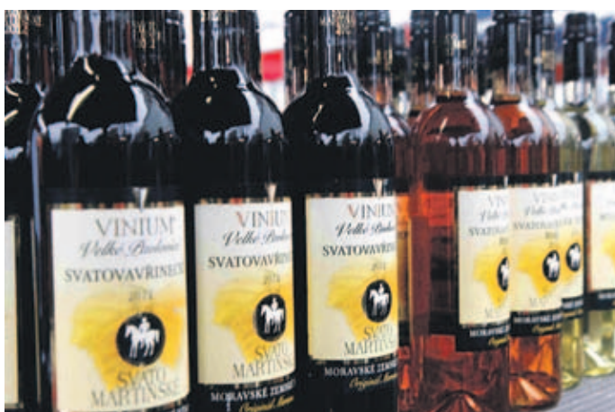
Svatomartinské mělo úspěch