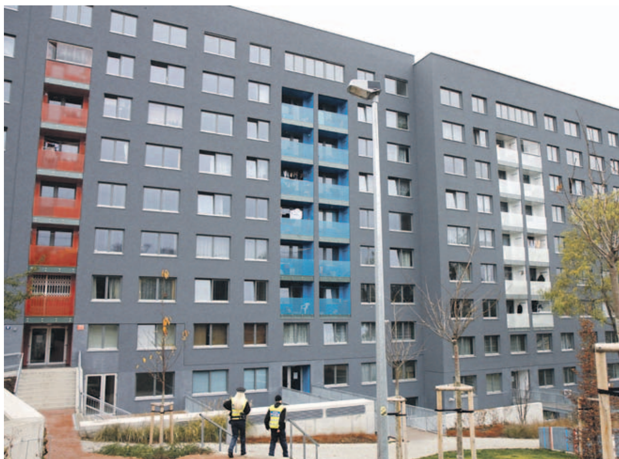
Zrekonstruovaný bytový dům v Lupáčově ulici půjde do privatizace v červnu 2013

Nový harmonogram počítá s postupnou privatizací 117 bytových domů, jejichž odprodej je rozdělen do několika fází (viz tabulka na protější straně). Jako první přijdou na řadu bytové domy, u nichž jsou vyřešeny všechny technické a právní okolnosti. Následovat budou domy, které prošly komplexní rekonstrukcí, a po nich pak cihlové domy, které žádné významnější přestavby nevyžadují. Další v řadě budou podle harmonogramu panelové domy, které ale před samotnou privatizací projdou zateplením fasád