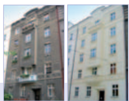
PŘED REKONSTRUKCÍ / PO REKONSTRUKCÍ