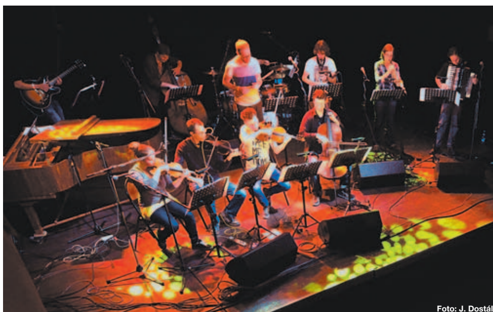
Wrgha Powu Orchestra