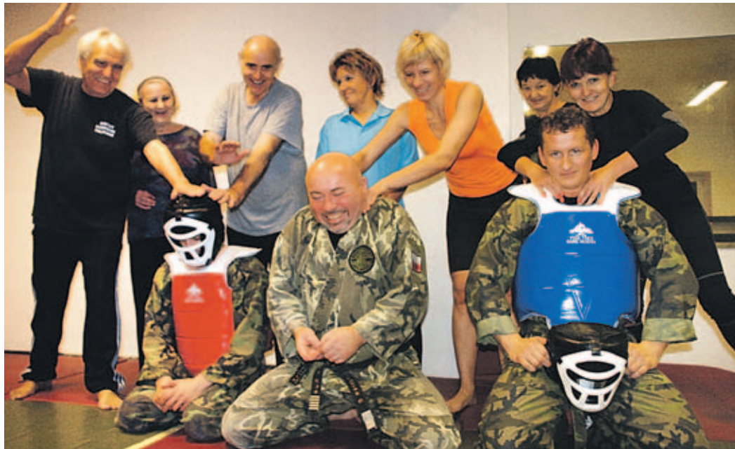
Účastníci kurzů sebeobrany se svými instruktory