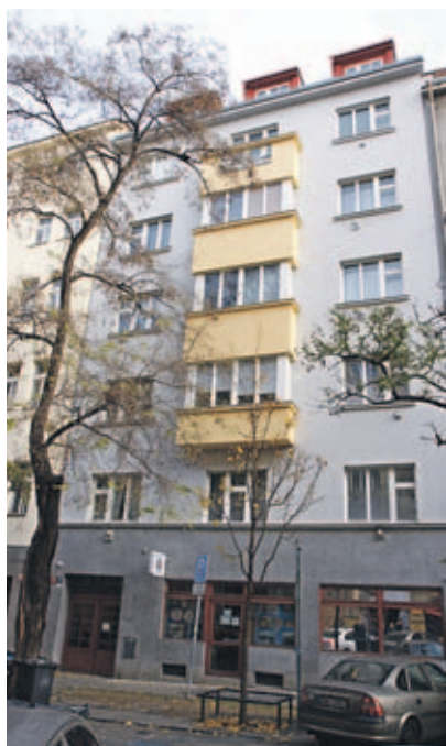
Bytový dům v Řipské ulici...