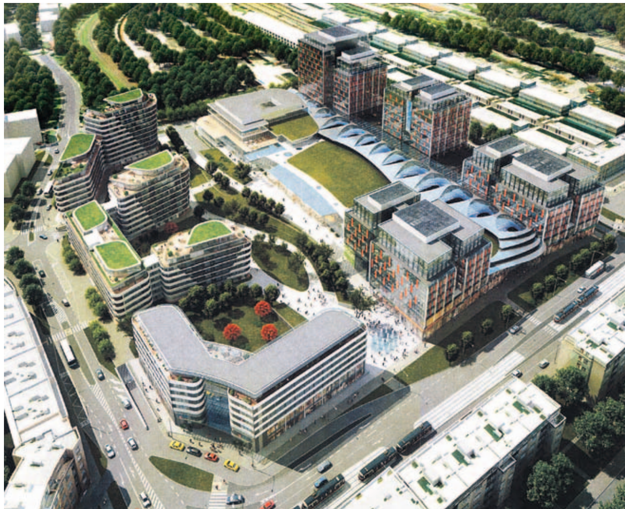
Vizualizace plánovaného projektu zástavby v severozápadní části nákladového nádraží (pohled od Basilejského nám.)

Jak se k celé věci postaví investor plánovaného víceúčelového projektu, se v současné době