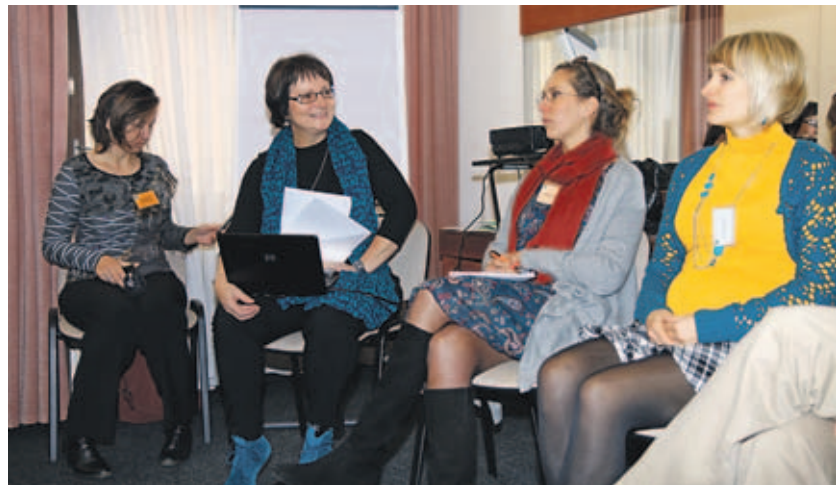
Konference o krizové intervenci v hotelu Olšanka

Jaký je systém krizové pomoci v České republice – co funguje, co chybí a jaká jsou doporučení pro poskytovatele krizových služeb – bylo ústředním tématem konference, kterou uspořádalo občanské sdružení Remedium ve dnech 30. a 31. října v hotelu Olšanka.