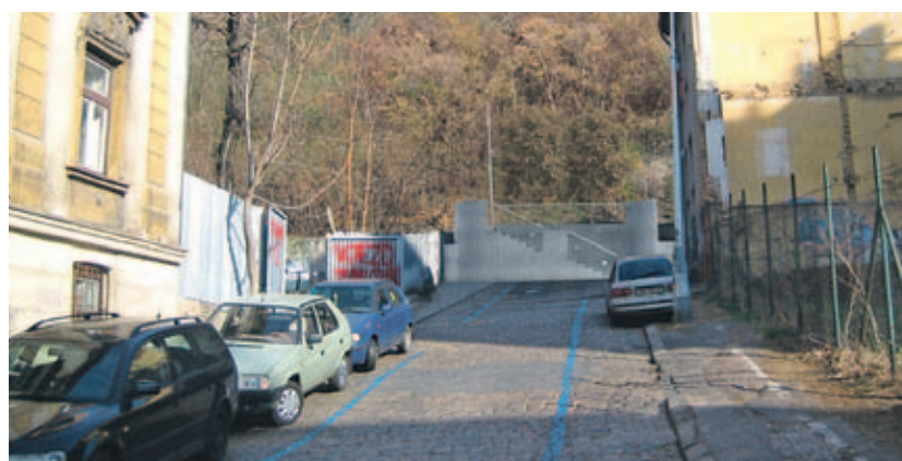
Jedna z navržených variant v ulici Pod Vítkovem

Výstavbu nových vstupů komplikuje fakt, že jak stezka samotná, tak pozemky kolem stezky nepatří