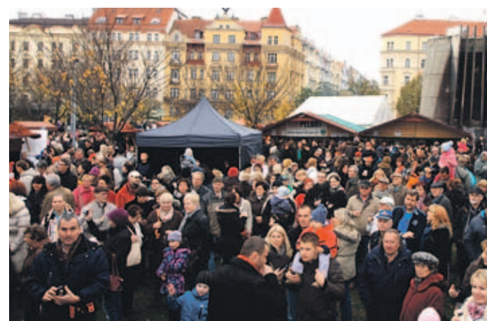
Na Jiřáku se příjemně degustovalo