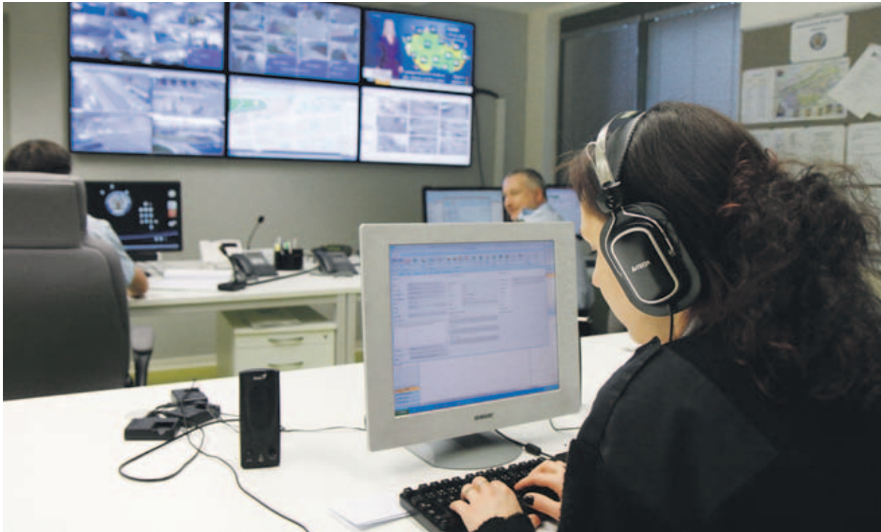
Nový monitorovací systém výrazně pomáhá strážníkům z Prahy 3 v jejich práci