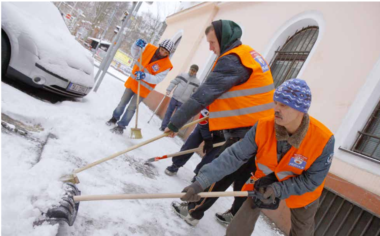
V Praze 3 nezaměstnaní pomáhají s úklidem ulic