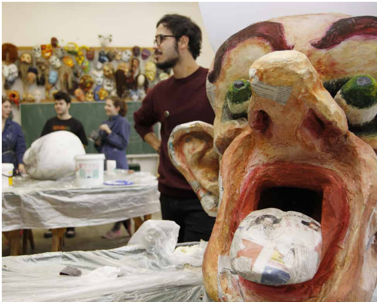
O masky do masopustního průvodu se postarali studenti Střední uměleckoprůmyslové školy na Žižkově náměstí

První větší zastávka bude v Mahlerových sadech u Žižkovské věže, kde budou rozdávány koláče a bude zde pokračovat kulturní program. Poté průvod