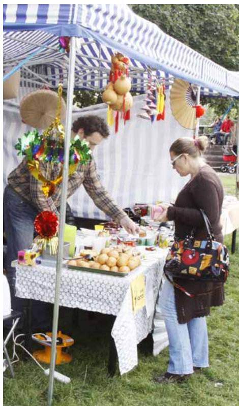
Seznámit se s různými kulturami bylo možné v září na Parukářce

Pro cizince ohrožené sociálním vyloučením kvůli neznalosti jazyka, zákonů, práv a povinností v různých oblastech života existuje v Praze mnoho organizací, které se zabývají pomocí při jejich snazším začlenění do společnosti. S řadou z nich Praha 3 na projektu spolupracovala.