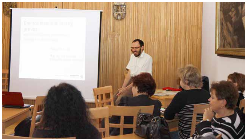
Semináře se zúčastnili zaměstnanci Úřadu městské části Praha 3

Úvodní seminář k tématu Zelené úřadování pod názvem „Environmentálně šetrný provoz aneb na úřadech a v kancelářích ekologicky i ekonomicky“ se uskutečnil ve čtvrtek 10. ledna na radnici třetí městské části.