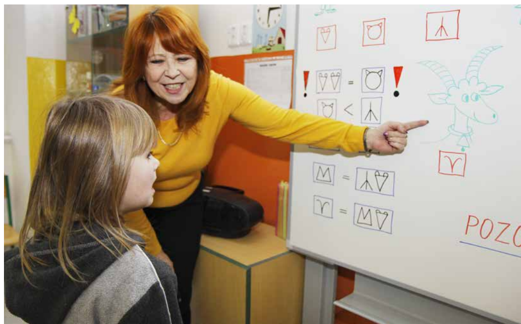
Malí prvňáčci si odbyli premiéru před tabulí

Ve středu 16. a ve čtvrtek 17. ledna probíhaly na základních školách v Praze 3 zápisy do prvních tříd. Rušno bylo i na Základní a mateřské škole Jaroslava Seiferta ve Vlkově ulici.