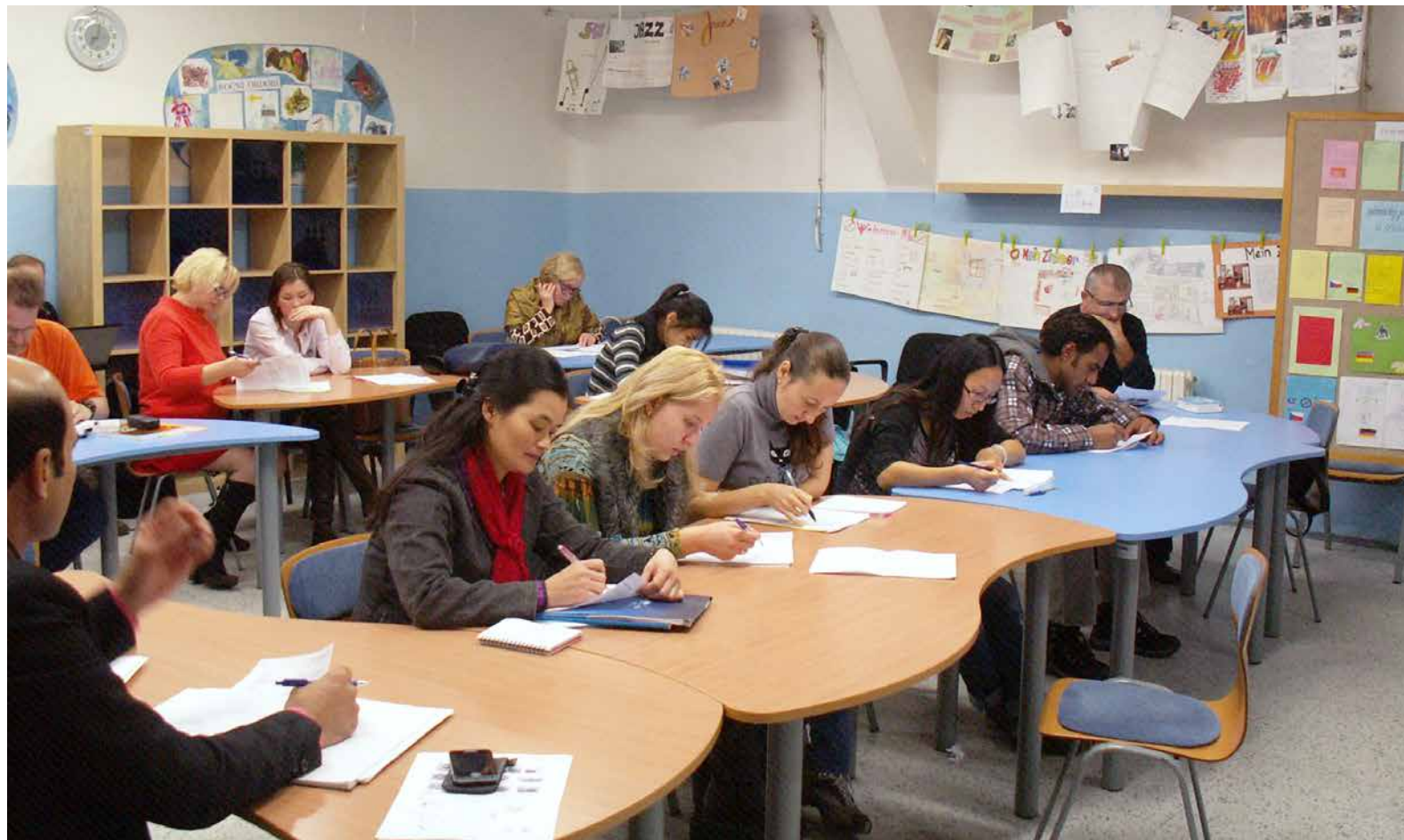
Kurzy češtiny pro cizince probíhaly také v učebnách ZŠ náměstí Jiřího z Poděbrad

„Poznáním k vzájemné toleranci“ byl název emergentního projektu cíleného na integraci cizinců, který ve druhé polovině loňského roku uskutečnila městská část Praha 3. Projekt byl hrazen z prostředků dotace Ministerstva vnitra ČR se spoluúčastí třetí městské části.