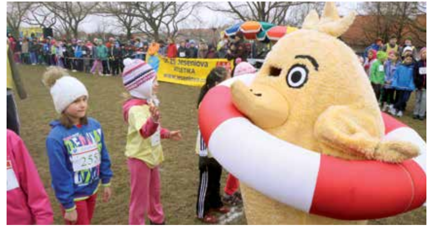
Aprilový běh s kuřetem spojuje sport s dobročinností

V parku Židovské pece se 4. dubna konal v pořadí už devatenáctý ročník Aprílového běhu s kuřetem. Na jeho start se postavilo více než 440 malých atletů. „Závod je určen pro děti ve věku od 7 do 10 let. Aprílový běh s kuřetem může být proní akcí, která je osloví. V rámci závodu se ale děti seznamují také s Nadací rozvoje občanské