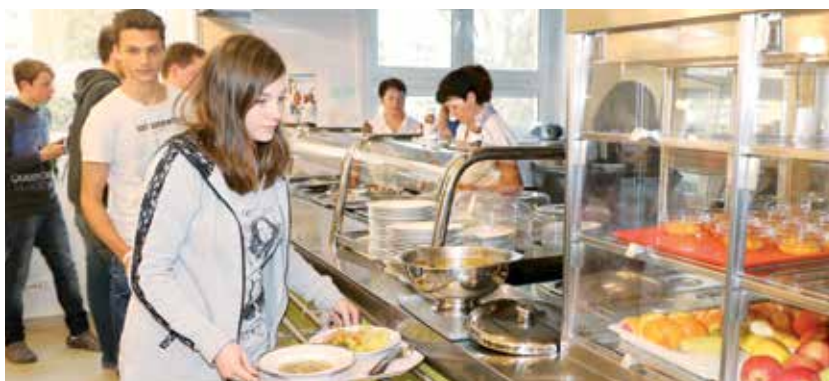
ZŠ Jeseniova poskytuje stravovací služby na vysoké úrovni

Prohlídka další jídelny, tentokrát v Základní škole Jeseniova, probíhala za plného provozu