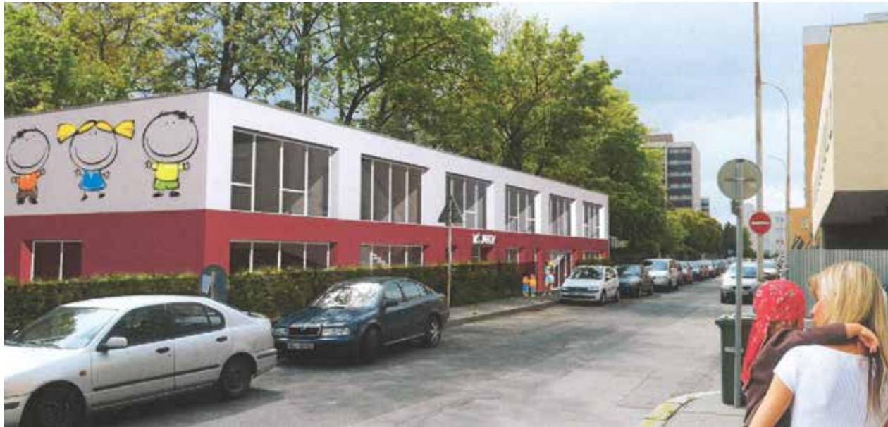
Vizualizace nové školky v areálu ZŠ V Zahrádkách, která nabídne místa pro 112 dětí

Radnice třetí městské části vyjde vstříc rodičům, jejichž děti čekají na umístění do mateřské školy. V letošním roce plánuje navýšení kapacity už fungujících zařízení i zahájení výstavby zcela nové mateřinky.