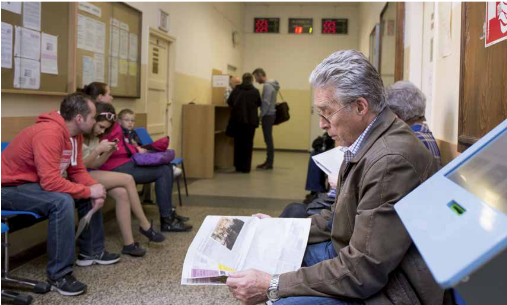
Všechny agendy bude Úřad MČ Praha 3 vyřizovat v jedné lokalitě