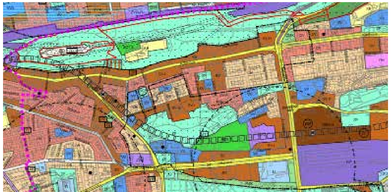
Stávající územní plán, který je k nalezení na www.uppraha.cz , používá k rozlišení funkčního využití pozemků 28 barev

Nový územní plán je navržen jako dvouúrovňový. První úroveň bude tvořit celopražský plán v měřítku 1:10 000, druhou úroveň pak podrobnější mapy vybraných, zejména rozvojových lokalit v měřítku 1:5000. Stanovit pro stabilizovaná území nižší míru regulace a pro rozvojová naopak přísnější je podle představitelů radnice v zásadě dobrá myšlenka. „Problém ale je, že