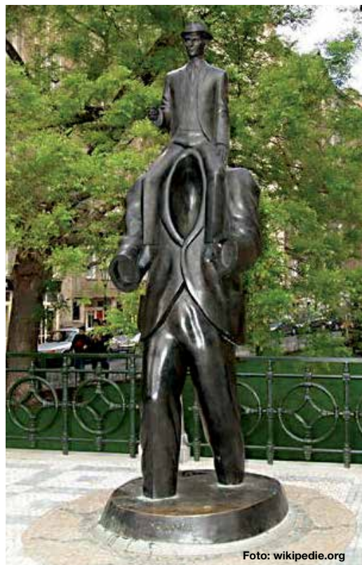
Pomník F. Kafky

Já byl od roku 1983 sledován Státní bezpečností a snažili se mě nějakým způsobem kontaktovat a získat pro spolupráci, což se nepovedlo. A tak mě přeřadili do kategorie nepřátel státu. Ale doba se naštěstí relativně uvolnila a my se chtěli oprostít od Svazu výtvarných umělců, protože jsme byli radikálové v tom, co jsme dělali. Vedli jsme proti němu takovou válku. Založili jsme aktiv, a když jsem měl projev, tajně si ho rovnou těsnopisem zapisovali. Nikdy mě ale nezatkli, protože už byla jiná doba. Jen zastrašovali a vyvíjeli tlak.