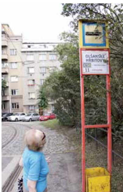
Tramvaj 11 dnes končí na zastávce Olšanské hřbitovy

V Praze 3 jde především o změnu trasy tramvajové linky 11, která dnes končí ve stanici Olšanské hřbitovy. Nově by totiž měla ve všední dny mezi 6. až 20. hodinou jezdit až na Jarov, kam by směřovaly soupravy v intervalu 8–10 minut. V ostatních případech by pak jedenáctka končila tak jako dosud na Olšanských hřbitovech. Návrh také počítá se zavedením zcela nové linky 13, která by měla z náměstí Bratří Synků jezdit po trase jedenáctky až na Černokosteleckou a zahrnuje rovněž redukci dvouvozových souprav linky 5 na jeden vůz.