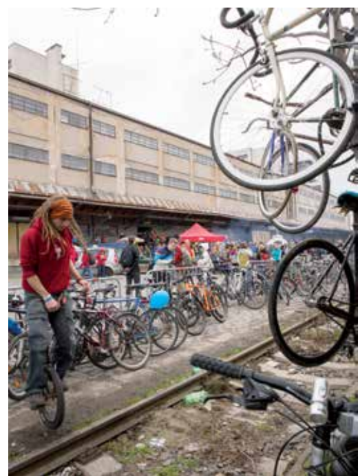
V dubnu hostilo nádraží jarní cyklojízdu, v létě se tu bude konat výstava moderního umění