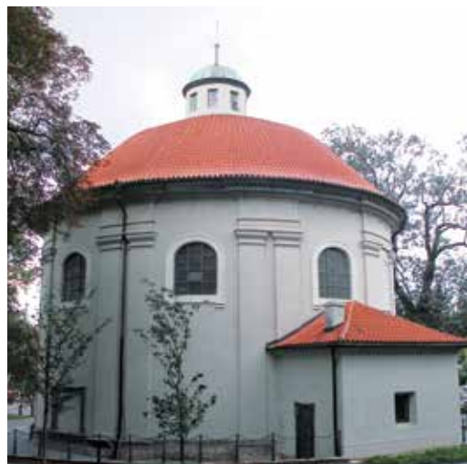
Kostel svatého Rocha na Olšanském náměstí

Již pátým rokem se k této dnes mezinárodní iniciativě přidávají i křesťanské chrámy v České republice. Proto přijměte naše pozvání na Noc kostelů , která se bude konat také v letošním roce i v Praze 3.