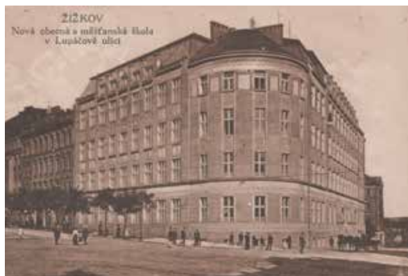
Historické fotografie a další dokumenty jsou k vidění na výstavě ve školní galerii Lupa

Dnes patří Lupáčovka mezi rodiči velmi vyhledávané základní školy. Učí podle vlastního vzdělávacího plánu, v rámci něhož se zaměřuje na výuku cizích jazyků a informačních technologií, včetně jejich využití