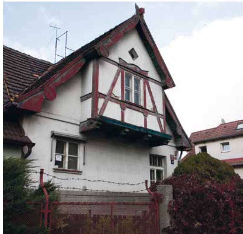
Kolonie si i dnes zachovává svůj nezaměnitelný půvab...