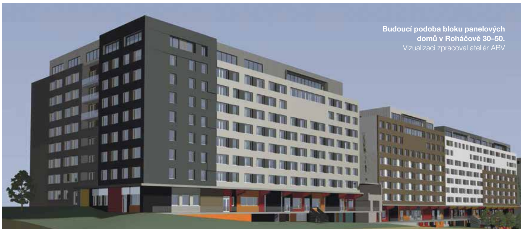
Budoucí podoba bloku panelových domů v Roháčově 30–50. Vizualizaci zpracoval ateliér ABV