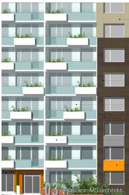
vizualizace: MS architekti

-sak- Lodžie by měly být vybaveny květináky