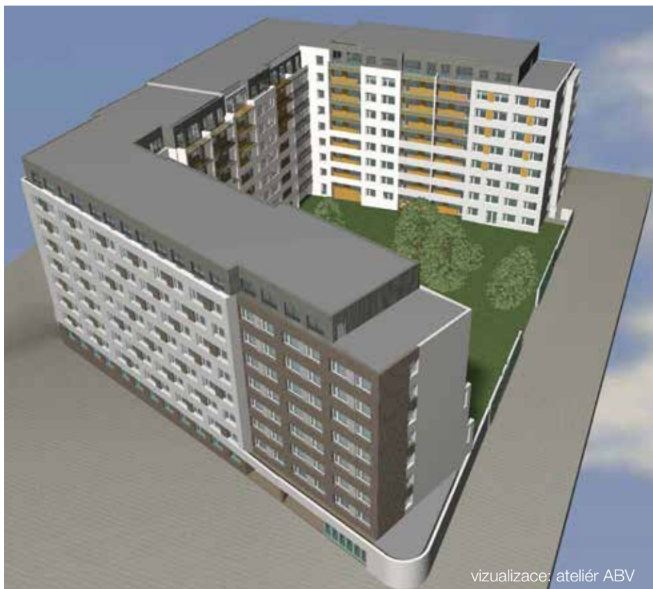
vizualizace: ateliér ABV

Současná podoba bloku domů mezi ulicemi Jeseniova, Rokycanova, Sabinova a Českobratrská