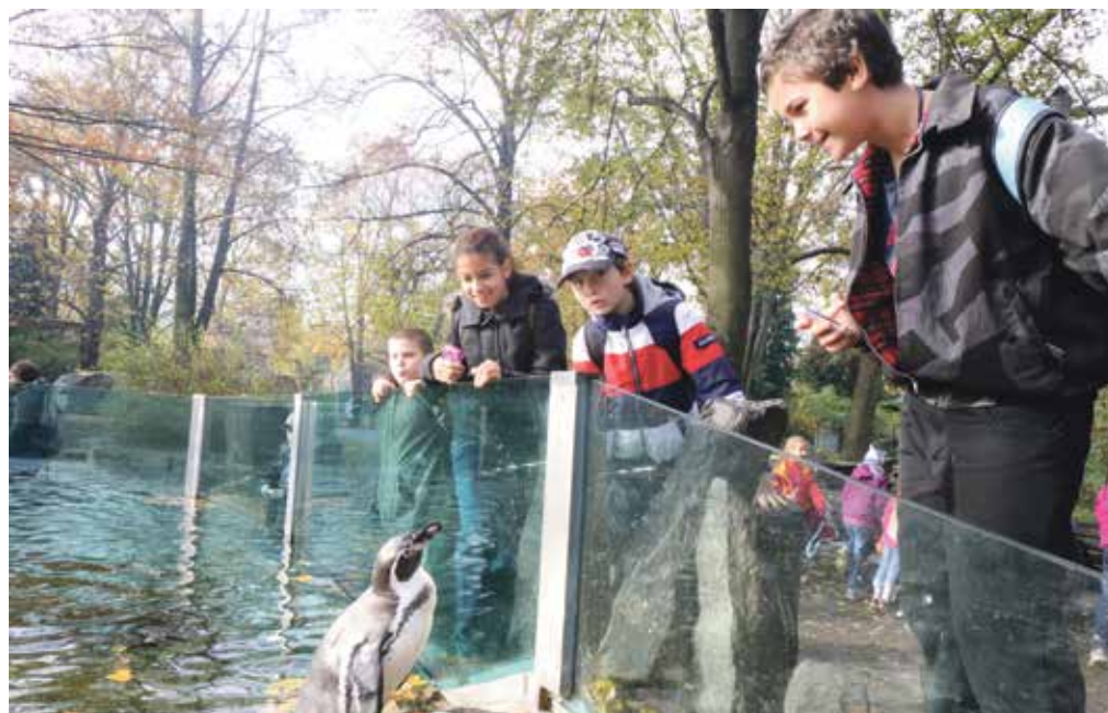
V rámci speciální akce pro školáky z třetí městské části zavítali do pražské zoo také žáci páté třídy ZŠ Chelčického

Třetí městská část poskytla Zoo Praha finanční dar ve výši 3 milionů korun na likvidaci následků