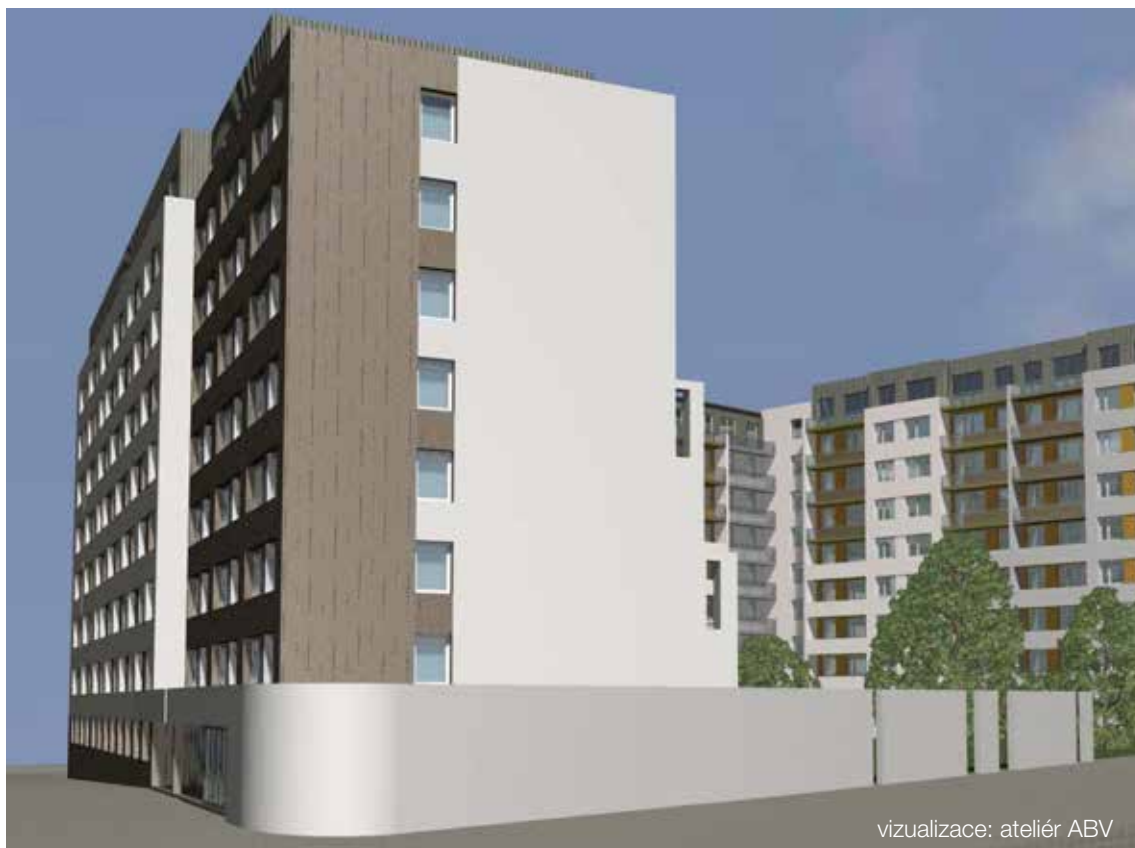
vizualizace: ateliér ABV

Blok domů mezi ulicemi Jeseniova, Rokycanova, Sabinova a Českobratrská by měla uzavřít zeď, která bude kopírovat tzv. uliční čáru. O definitivní barvě fasády ještě není rozhodnuto.