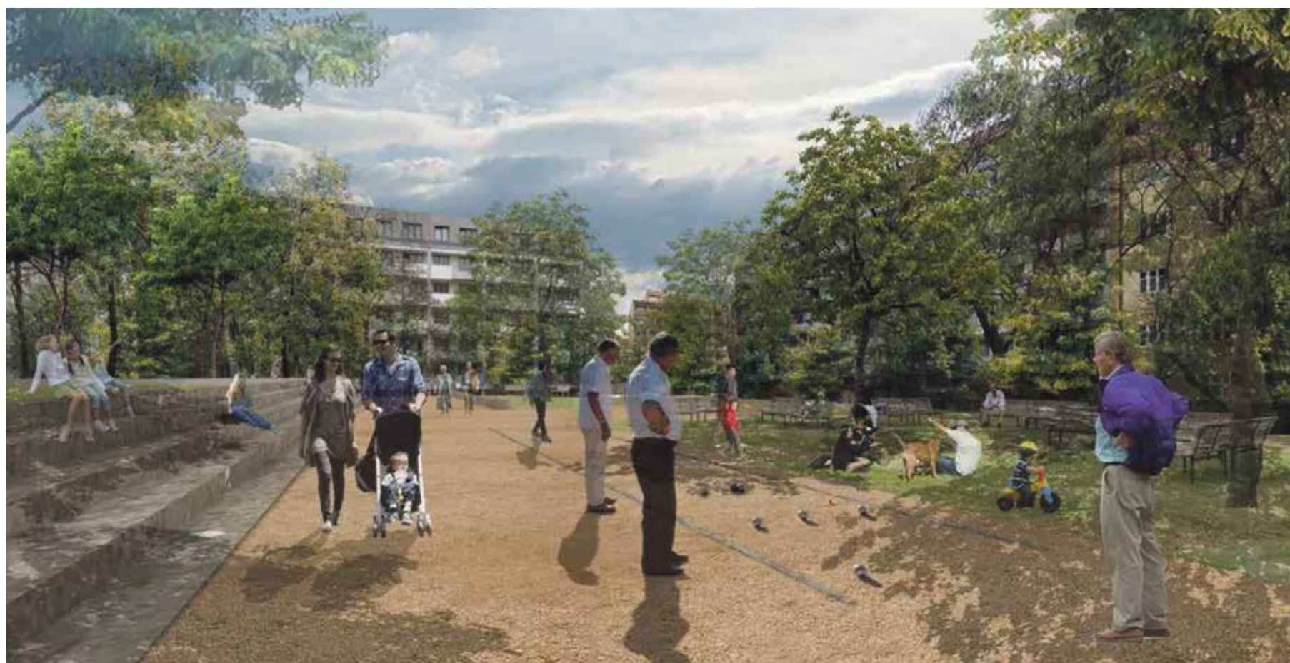
Vizualizace architektonického ateliéru MCA ukazují, jak bude Komenského náměstí vypadat v budoucnosti

Vítězný architektonický návrh z dílny ateliéru MCA, který promění vzhled náměstí, pomáhali radníci kromě odborníků vybírat i místní obyvatelé. Do jeho konečné podoby mohli promluvit jak v debatě, tak prostřednictvím ankety.