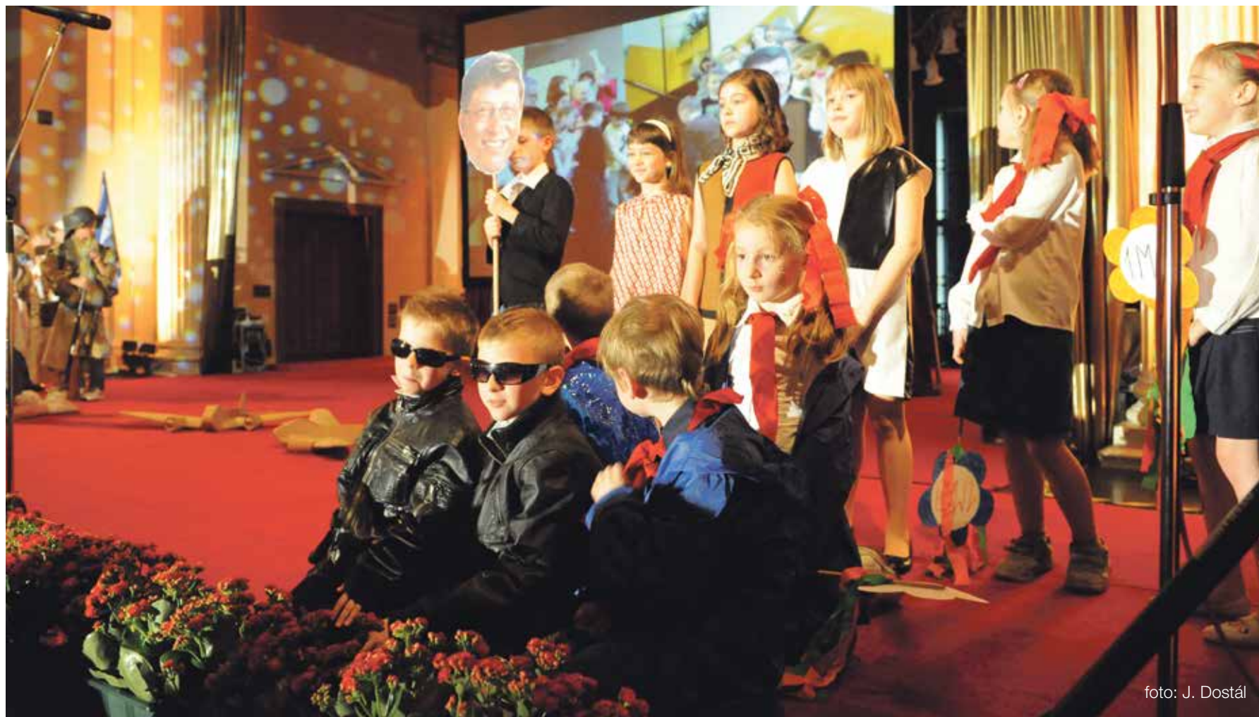
Vystoupení žáků z Lupáčovky při květnovém galavečerem na Žofíně sklídilo nadšené ovace rodičů a dalších přítomných návštěvníků

Už v dobách Rakousko-Uherska mířili školáci do budovy v Lupáčově ulici. Tenkrát nesla název Jubilejní obecná škola císaře Františka Josefa I. Stoleté výročí si základní škola v Lupáčově ulici připomněla již v květnu galavečerem na Žofíně, oslavy pak vyvrcholí 30. listopadu vzpomínkovým setkáním bývalých učitelů i žáků školy.